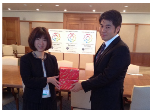
大阪市役所を表敬訪問

2017年9月にブラジルで開催された日本語弁論大会の成績優秀者1名を2018年3月に受け入れました。約2週間の滞在期間中に、大阪市役所やオオサカ学校の姉妹校である田辺小学校、さらには日本の老舗企業の訪問やナレッジキャピタルなどを訪問しました。