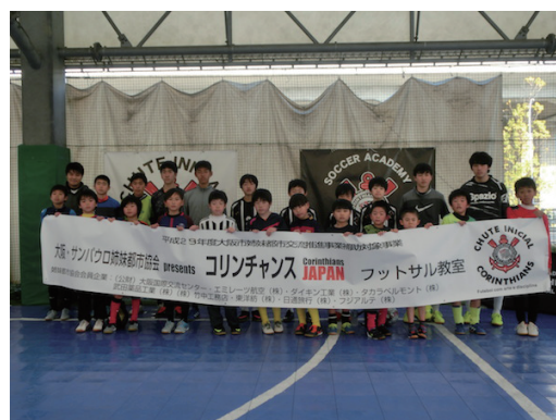
フットサル教室参加者と